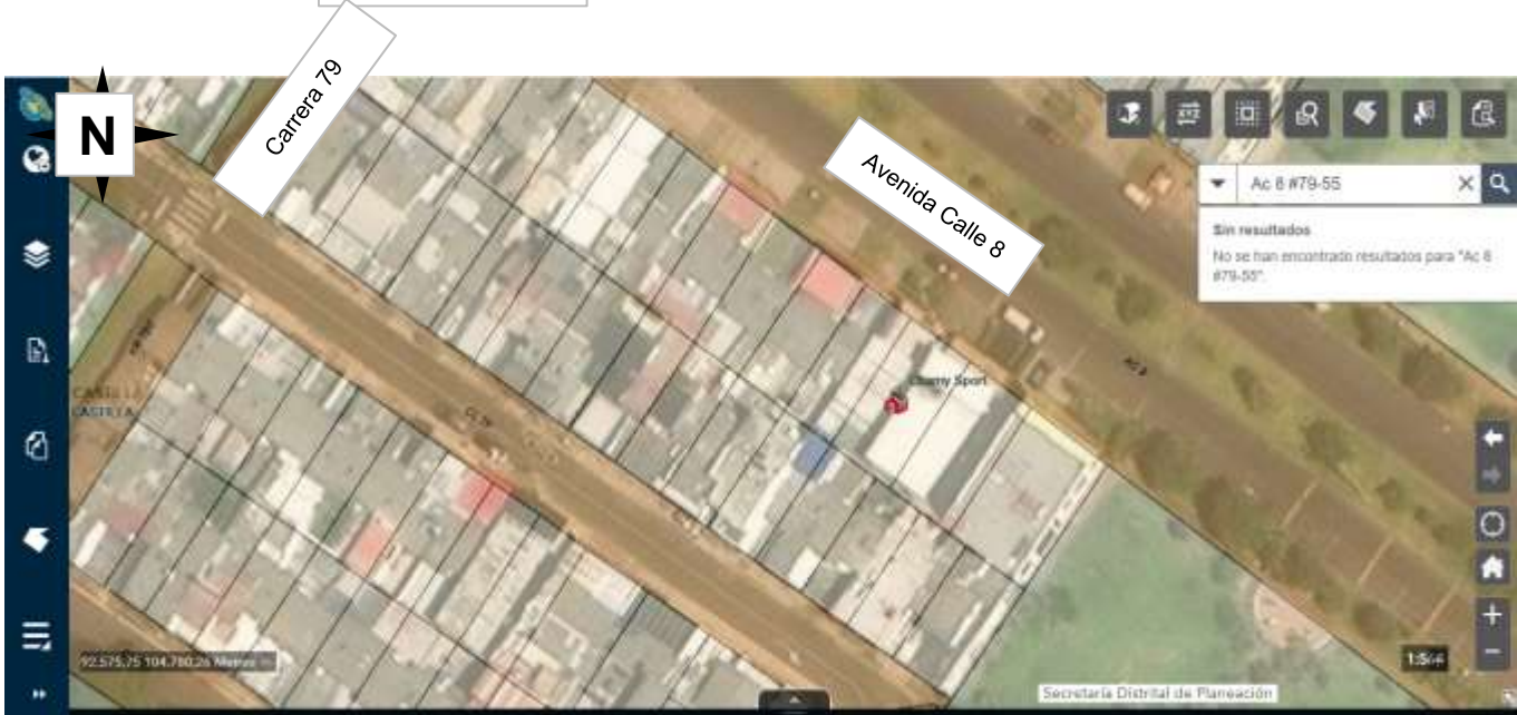
GRAFICO No. 1

En atención a la orden de trabajo 20245840010183 del Dieciocho (18) de Agosto del 2024, el cual hace parte integral el Expediente No. 2023584490101504E de 2023 de la INSPECCIÓN OCTAVA “G” DISTRITAL DE POLICÍA de la ALCALDIA LOCAL DE KENNEDY, se realiza visita técnica mediante un registro fotográfico y ocular al predio localizado en la Calle 8 N.o 79-55, se encuentra al momento de la visita: